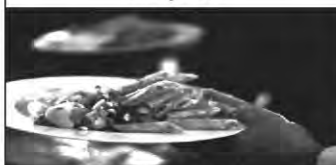
Fleisch - Fisch